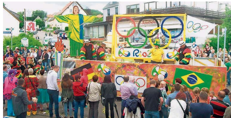
Fasend wird olympische Disziplin: Das forderten die Karnevalisten aus Eisen.

Im Festzelt war abschließend der Auftritt der Band Bruise Brassers angesagt. Na denn bis 2027 zur nächsten Geburtstagsparty.