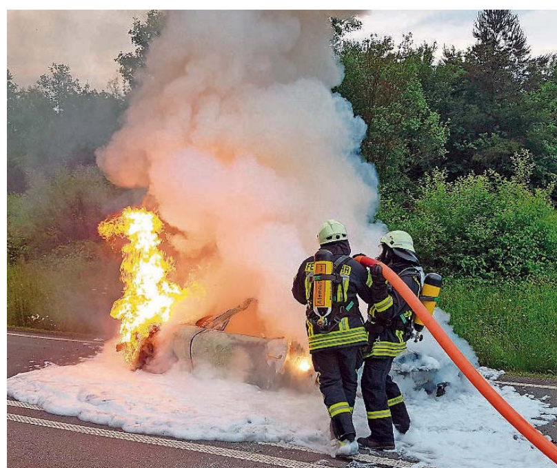
Unter Atemschutz löschte die Feuerwehr den Porsche auf der Autobahn.

Mehrere Polizeiautobahnstationen in Rheinland-Pfalz und Baden-Württemberg sind über den Sachverhalt informiert. Von dort aus wird nach möglichen Unfallstellen gesucht. him