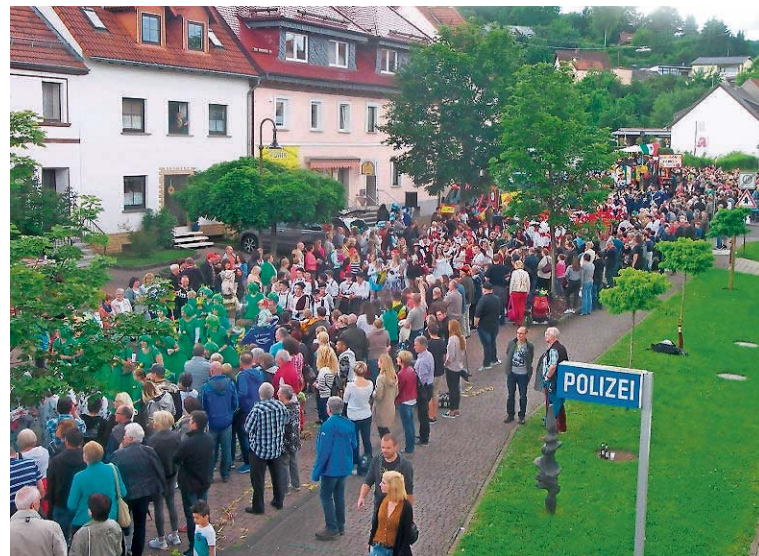
Dicht gedrängt verfolgten tausende Zuschauer den Umzug, hier vom Rathaus aus gesehen.