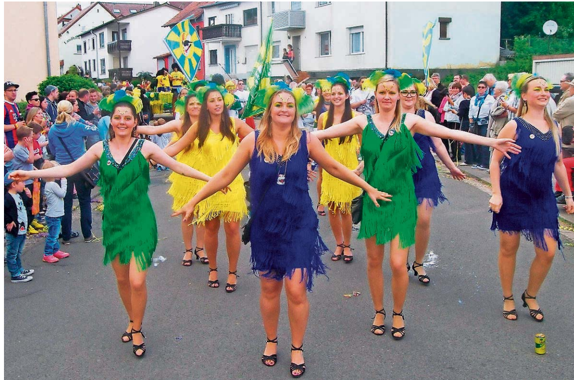
In passenden Kostümen für einen Sommerumzug tanzten diese Sambatänzerinnen des OCV mit.

Krasse Gegensätze folgen. Die Kicker aus Güdesweiler sind noch immer vom Aufstieg in die Landesliga berauscht. Über den Fluch der Kreisliga A klagen die Fußballer aus Oberthal und Gronig. Schicksal: Nach oben läuft nie was, und tiefer geht es nimmer. Seit 30